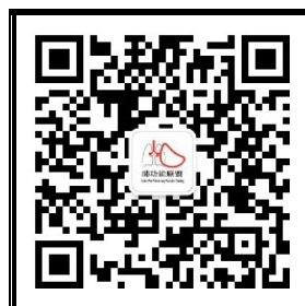
“中国肺功能联盟”微信公众号 微信号:fgnlm_cn

国家呼吸系统疾病临床医学研究中心 国家呼吸医学中心 中国肺功能联盟 赤峰市第二医院